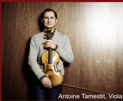
Antoine Tamestit, Viola